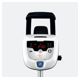
Quadro di comando Programmabile fino a 7 giorni