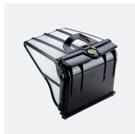
Cestello filtrante Facile accesso e grande capacità (5 litri)