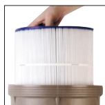
Facile da pulire