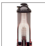
Parte interna filtro Star Clear