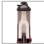
Filtre découpé Star Clear