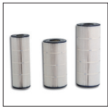
Cartouches de remplacement