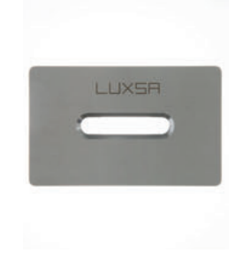
Copertura di scarico