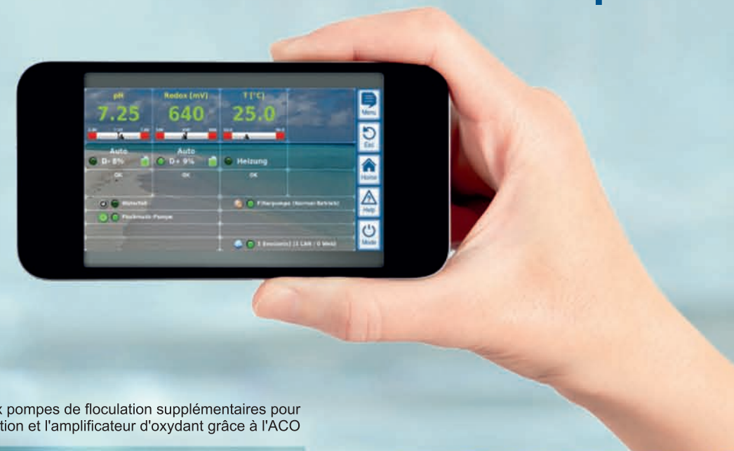
Image: version avec deux pompes de floculation supplémentaires pour le produit de floculation et l'amplificateur d'oxydant grâce à l'ACO