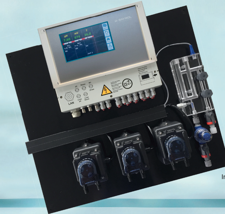
Image: version avec deux pompes de floculation supplémentaires pour le produit de floculation et l'amplificateur d'oxydant grâce à l'ACO

système prêt à brancher, prémonté sur une plaque PVC, comprenant pompes de dosage, cellule de mesure et cannes d'aspirations.