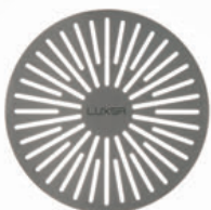
Evacuation de sol