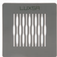
Evacuation de sol