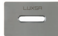
Buse à jets