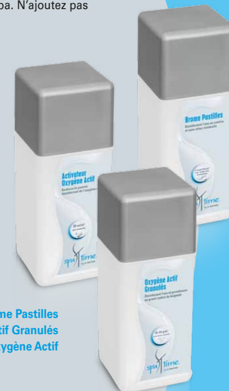
Brome Pastilles Oxygène Actif Granulés Activateur Oxygène Actif

Important : Pour optimiser l'efficacité des granulés, vous devez utiliser en plus l' Activateur Oxygène Actif .