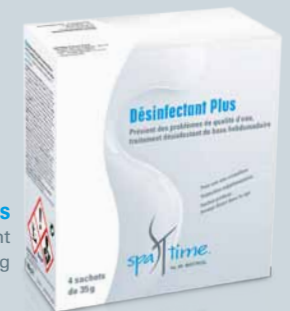
Désinfectant Plus boîte contenant 4 sachets de 35 g

Ce produit est compatible avec toutes les méthodes d'entretien (au chlore ou sans chlore tel que l'oxygène actif ou le brome).