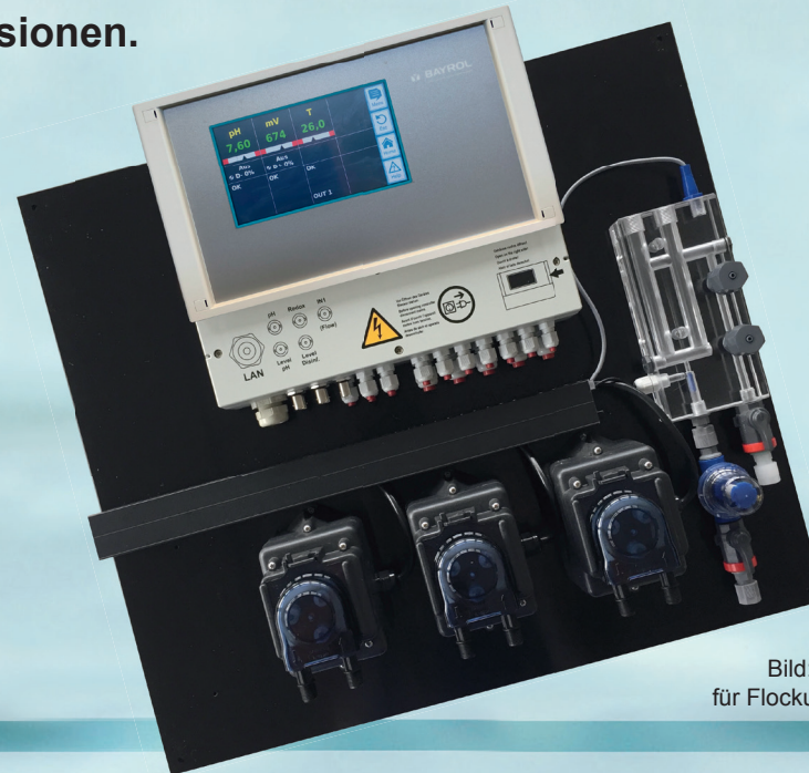
Bild: Version mit zwei zusätzlichen Floccospumpen für Flockungsmittel und Oxidationsverstärker durch ACO

Einfachste Montage steckerfertig, vormontiert auf isolierter Grundplatte, inkl. Dosierpumpen, Messkammer und Sauglanzen.