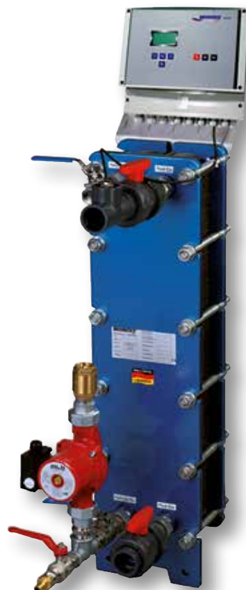
Platten-Wärmetauscher TSC 910 als Kompaktanlage

Durch ihre kompromisslos hochqualitative Auslegung eignen sich BEHNCKE-Platten-Wärmetauscher hervorragend - neben dem Einsatz im privaten Schwimmbad - auch für Anwendungen im öffentlichen, bzw. im industriellen Bereich. Für diese ganz speziellen Anfor-